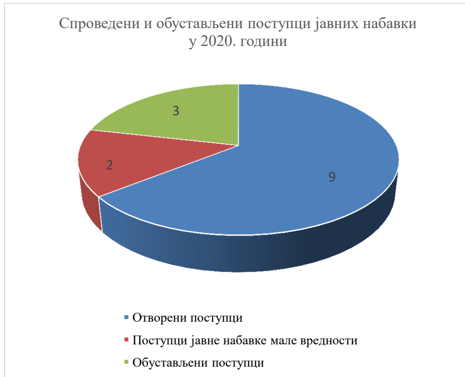
Графикон број 1. Графички приказ спроведених и обустављених поступака на основу Плана јавних набавки за 2020. годину